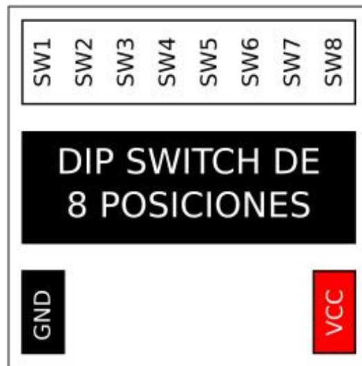
Figura2. Diagrama del módulo en bloques.